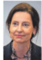
Minister Ultermark is de hoeder van de Grondwet in een kabinet dat de randen opzoekt. Kan zij de druk van de PVV weer- staan om een asielcrisis uit te