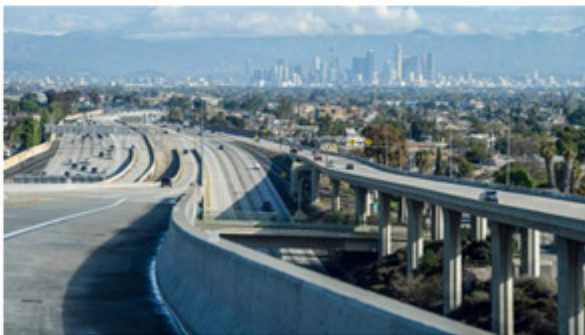
Los Angeles: iedereen moet binnen blijven