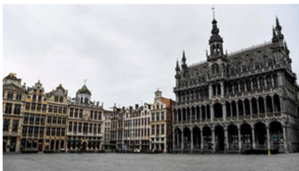
Grote Markt, Brussel