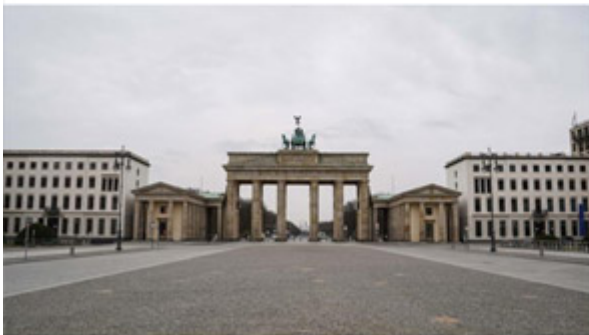
Brandenburger Tor, Berlijn