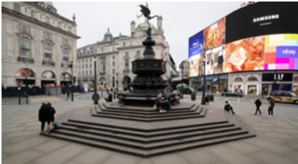
Piccadilly Circus, London

Onderstaande foto's krijg je anders nooit te zien.