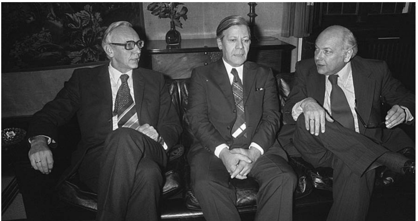
Premier Den Uyl ontvangt de Duitse bondskanselier Helmut Schmidt in het Catshuis. Links minister van Buitenlandse Zaken Max van der Stoel.

Het optreden van Den Uyl wordt nogal eens verklaard met het argument van de tijdgeest. Den Uyl zou als kind van zijn tijd in hoge mate rekening hebben moeten houden met zijn radicale vleugel omdat dit gezelschap de spreekbuis was van een brede en naar fundamentele veranderingen hunkerende maatschappelijke beweging van vakbonden, actievoerders, vormingswerkers, universiteitsdocenten, studenten en, niet te vergeten, 'kritische' journalisten. Ook zijn nieuwe biografie is niet helemaal ongevoelig voor deze 'hij moest wel'- redenering, waar heel wat tegenin te brengen valt.